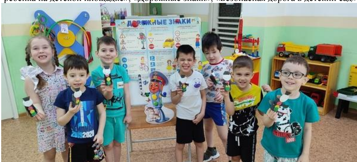
Консультация для родителей детей старшей "Б" группы по ПДД " Переходим дорогу правильно", " Во дворе и возле проезжей части" "Дорожное движение должно быть безопасным"

И вот чем мы занимались в этот период: Проводили беседы на темы : «Дети на улице», «Поведение ребенка на детской площадке», «Дорожные знаки», «Безопасная дорога в детский сад»